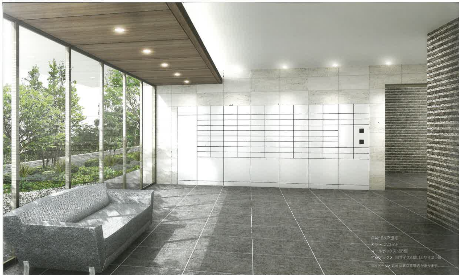
戸数: 88戸想定 カラー: ホワイト メールボックス: 88個 宅配ボックス: Mサイズ6個, Lサイズ1個 ※イメージと実物は異なる場合があります。