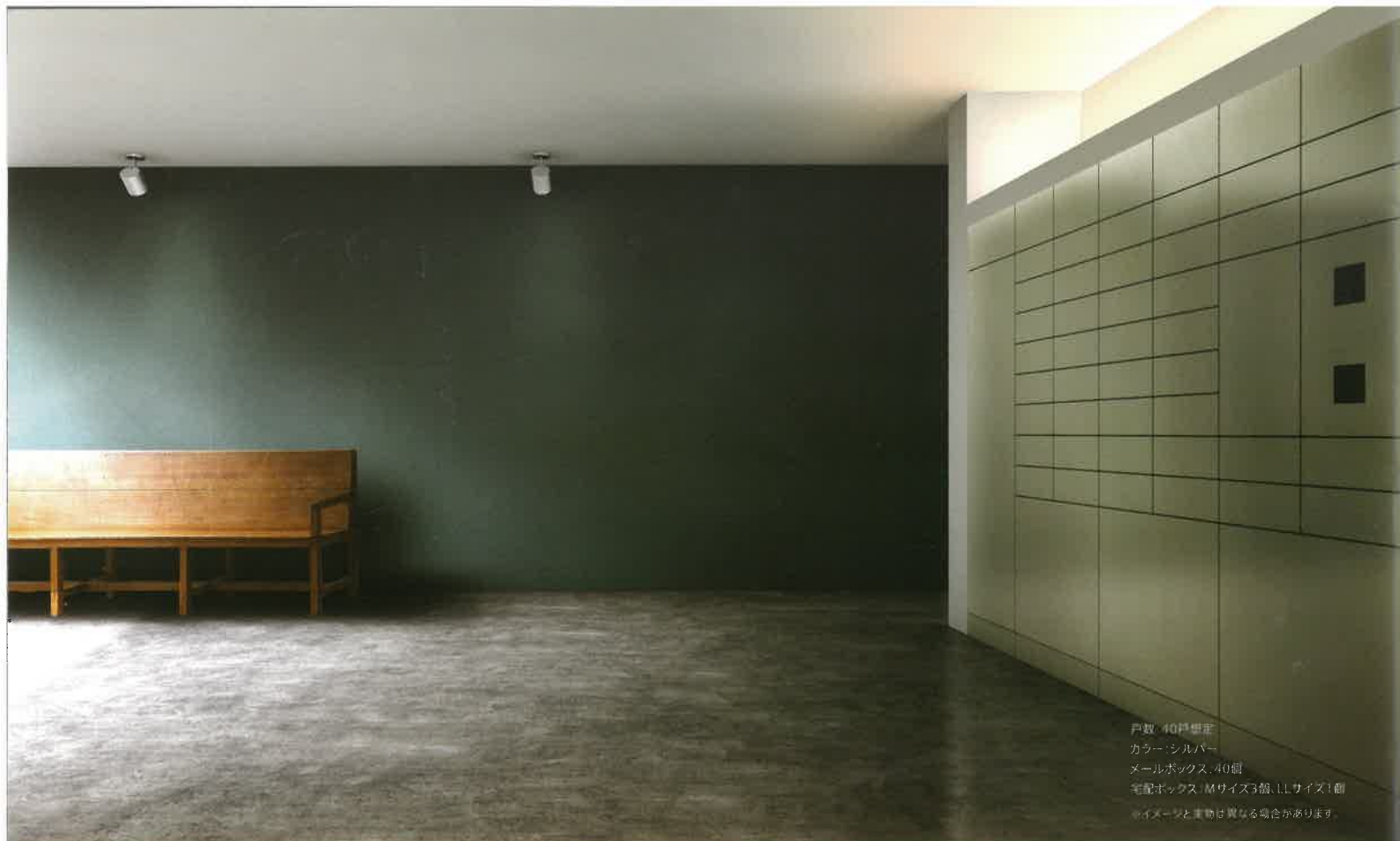
戸数：40戸想定 カラー：シルバー メールボックス：40個 宅配ボックス：Mサイズ3個、Lサイズ1個 ※イメージと実物は異なる場合があります。