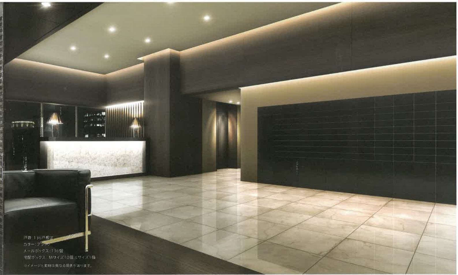
戸数: 136戸想定 カラー: ブラック メールボックス: 136個 宅配ボックス: Mサイズ10個, Lサイズ1個 ※イメージと実物は異なる場合があります。